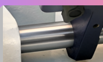
Eix crom dur